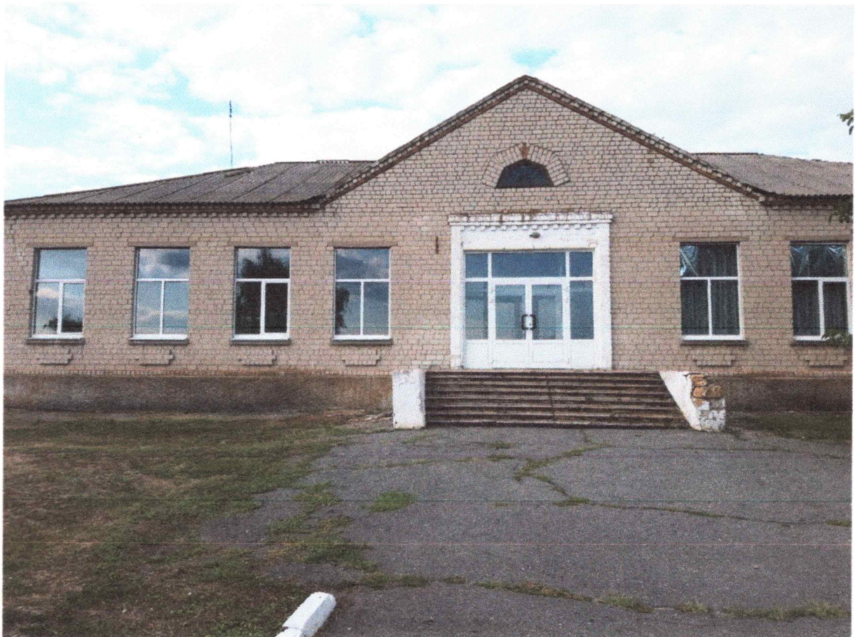
Проект «Друге життя» Андріївської початкової школи-відкриття «Фокус-хабу-центру дозвілля»